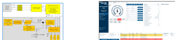
Figure 2 – Monopulse integration and new ACU interface